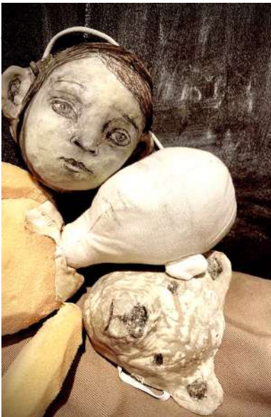
Maquettes Julie Desrosiers

Le personnage de Gamin sera au début interprété par un comédien, pour ensuite se démultiplier à différentes échelles, pour devenir à la fin de la pièce la marionnette du nouveau né.