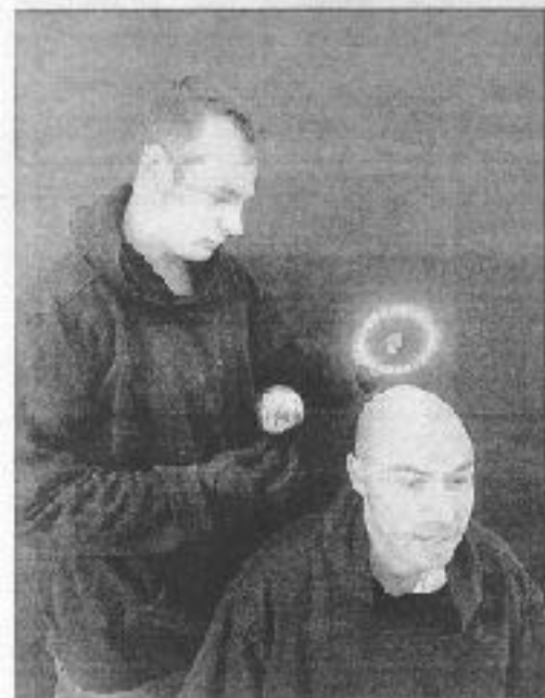
«Vie et mort du pacte charbon» propose un scénario de l'histoire de l'humanité en 10 minutes devant plus de 100 personnes devant lequel ils ont offert «La Grande Ouvre», leur dernier spectacle, un grand partenariat.